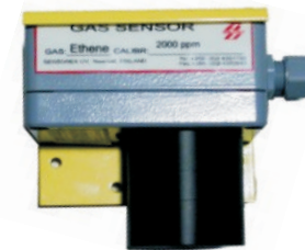
SX917/ C3H8 Hiilivetyanturi 4-20 mA lähetin